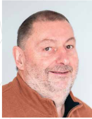
Leonhard Seitle Lager